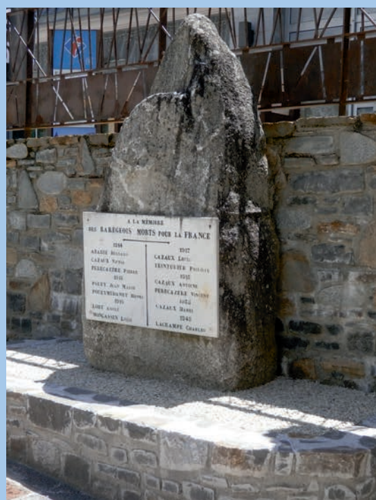
Le monument aux morts a fait l'objet d'une belle mise en valeur

Une fontaine d'eau potable a également été installée sur la place. Elle facilite ainsi l'accès à l'eau et limitera la proximité dans un espace déjà réduit.