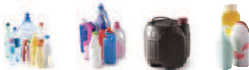
Bouteilles et flacons en plastique (avec bouchon)