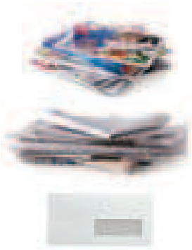
Journaux, papiers, magazines, cahiers, livres, enveloppes (avec ou sans fenêtre)