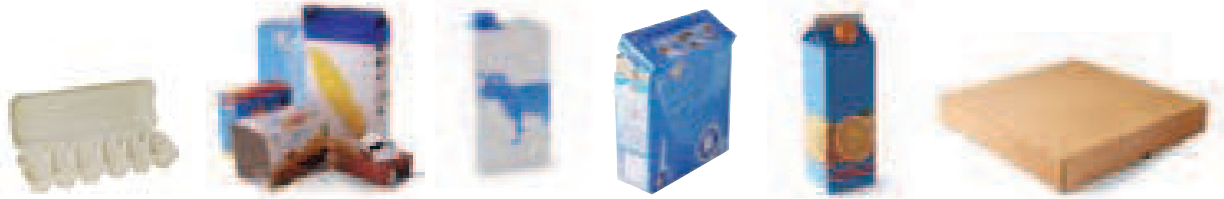
Petits cartons et briques alimentaires